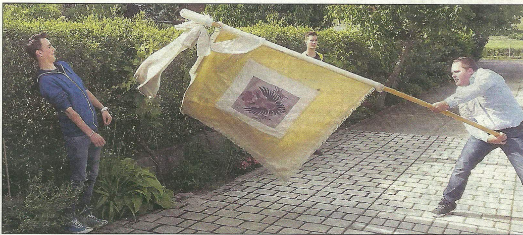
Erstes Training des neu gewählten Fähnrichs Patrik Wieder mit der Übungsfahne