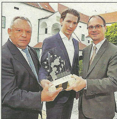
Strommer, Kurz und Steindl

Das Zusammenleben und den europäischen Gedanken im pannonischen Raum zu fördern – dafür steht der „Europäer“. Diesmal ging die Auszeichnung an das Bundesministerium für Europa, Integration und Außenbeziehungen. Stellvertretend für alle Mitarbeiter nahm Minister Sebastian Kurz den Preis von Europaforum-Präsident Franz Steindl und Obmann Rudolf Strommer entgegen. Mit dabei: Altlandesvize Franz Sauerzopf und der frühere Botschafter in Kroatien Rudolf Bogner mit Ehefrau Ilse.